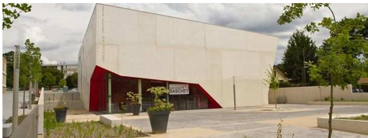
Le Centre Culturel Baschet

http://www.transports-daniel-meyer.fr/IMG/jpg/2007-2008_PLAN_DM_02-16.jpg